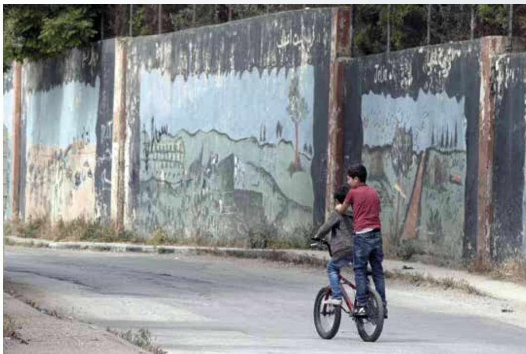
Bambini giocano lungo il muro di separazione