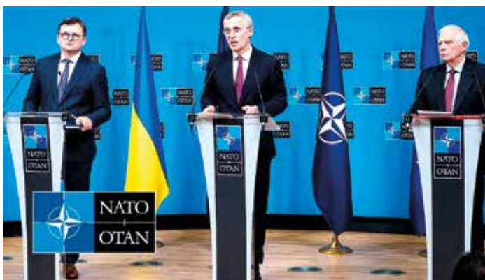
da sinistra: il Ministro degli esteri ucraino Dmytro Kuleba con il Segretario generale della NATO Jens Stoltenberg e l'Altorappresentante dell'EU per gli Affari esteri Josep Borrell (21 febbraio 2023)