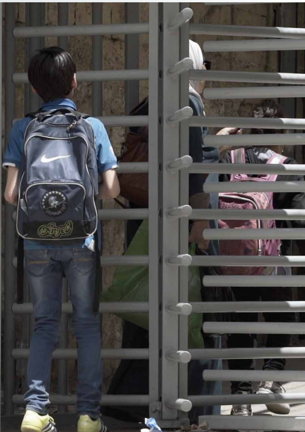
Un bambino attraversa un check-point per andare a scuola