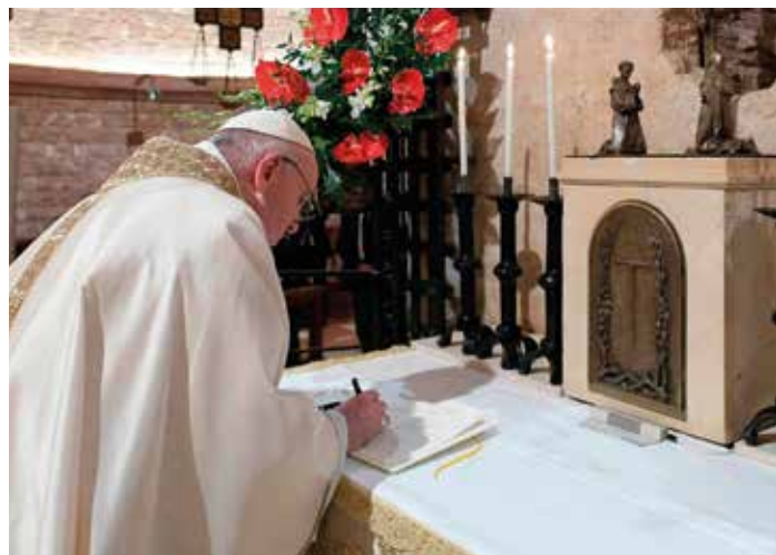
Papa Francesco firma l'Enciclica Fratelli tutti nella Basilica di san Francesco ad Assisi

Al dialogo e ai processi di incontro fondati sul rispetto della dignità della persona è dedicata la Fratelli tutti un'enciclica sociale, politica e pedagogo- ➔