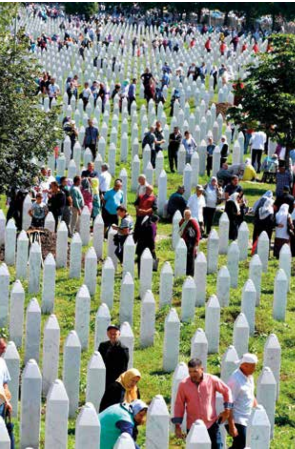
Una commemorazione delle vittime del massacro di Srebrenica al Memoriale-cimitero di Potocari in Bosnia-Erzegovina

difficoltà una piccola delegazione raggiunge Sarajevo assediata. Ma la guerra continua e così le vittime.